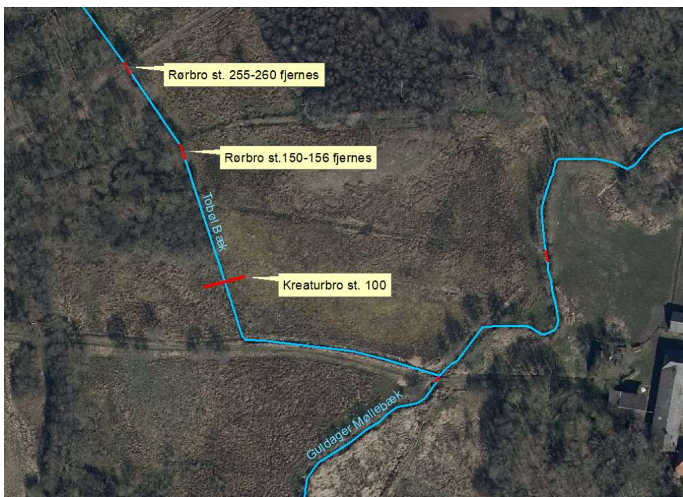
Krydsning af Tobøl Bæk i st. 100 med kreaturbro og fjernelse af to gamle rørbroer i st. 150-156 og st. 255-260.

Broen konstrueres som en 2 meter bred træbro med frit spænd over bækken. Broen forankres uden for vandløbsprofilet på 2 stk. 20 x 30 cm betonelementer, der vurderes at have tilstrækkelig tyngde til at forhindre opdrift ved oversvømmelse.